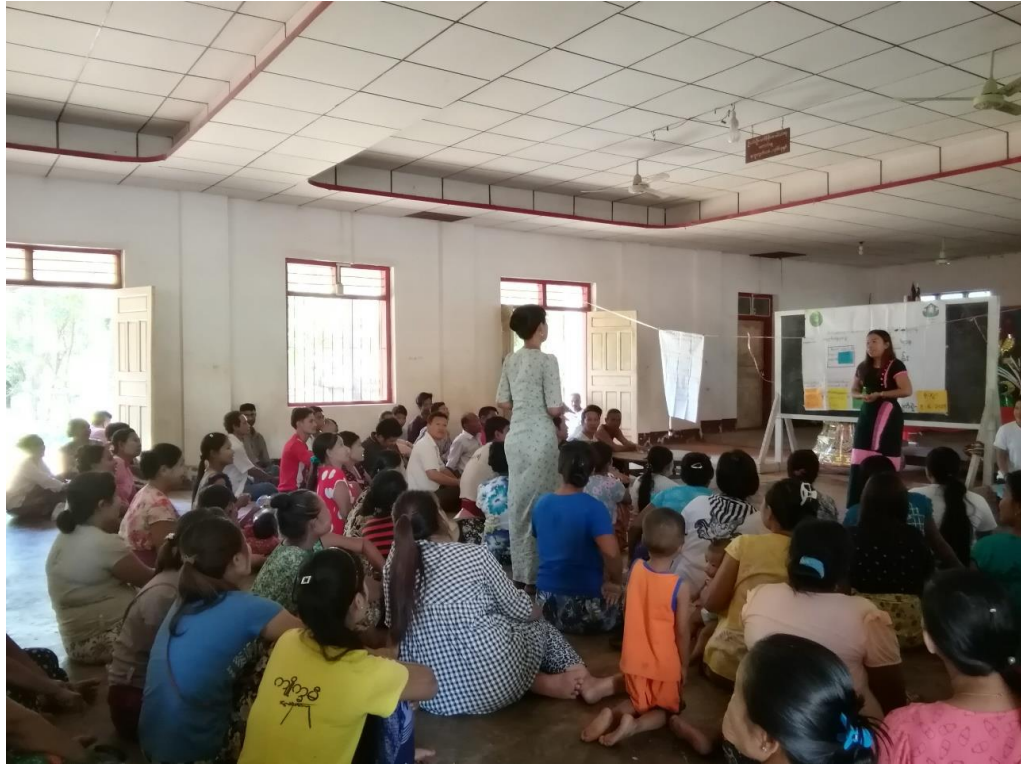
၉။ ကျေးရွာစီမံခန့်ခွဲရေးအဖွဲ့၏ အဖွဲ့ဝင်များစာရင်း။